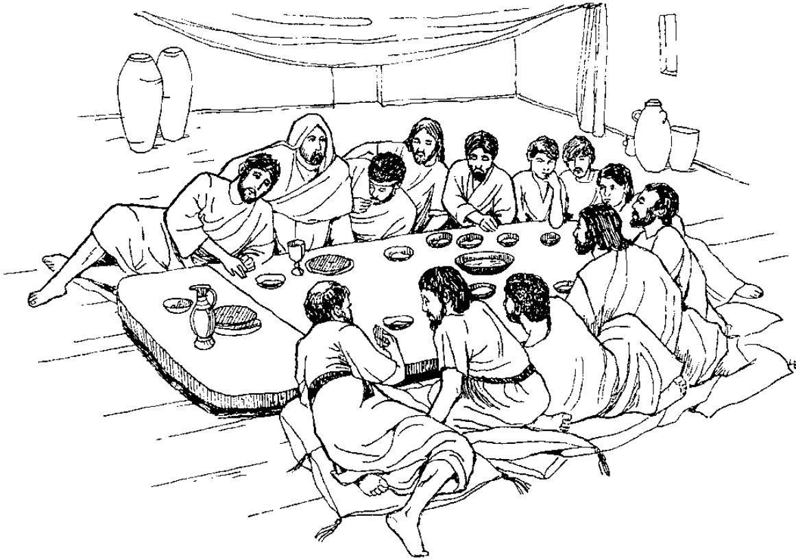
Nagagakan i Jisus am maamaya' No rano (13.21)

mataki'!" 28 Kaa' kolondo' sangelun pana intor risilo ondo' nangakan i, nakarati' kua indagu i Jisus ri Judas koson raginii. 29 Nga i Judas ti mampaguut ra ruit nilai, ginio ra kuukula' intor risilo nangkara' ra sinusub io ri Jisus mambali ra atan ondo' maatang ra pangiantakan, kaapoam manayar ra ruit no ra ulun kunsikang rali.