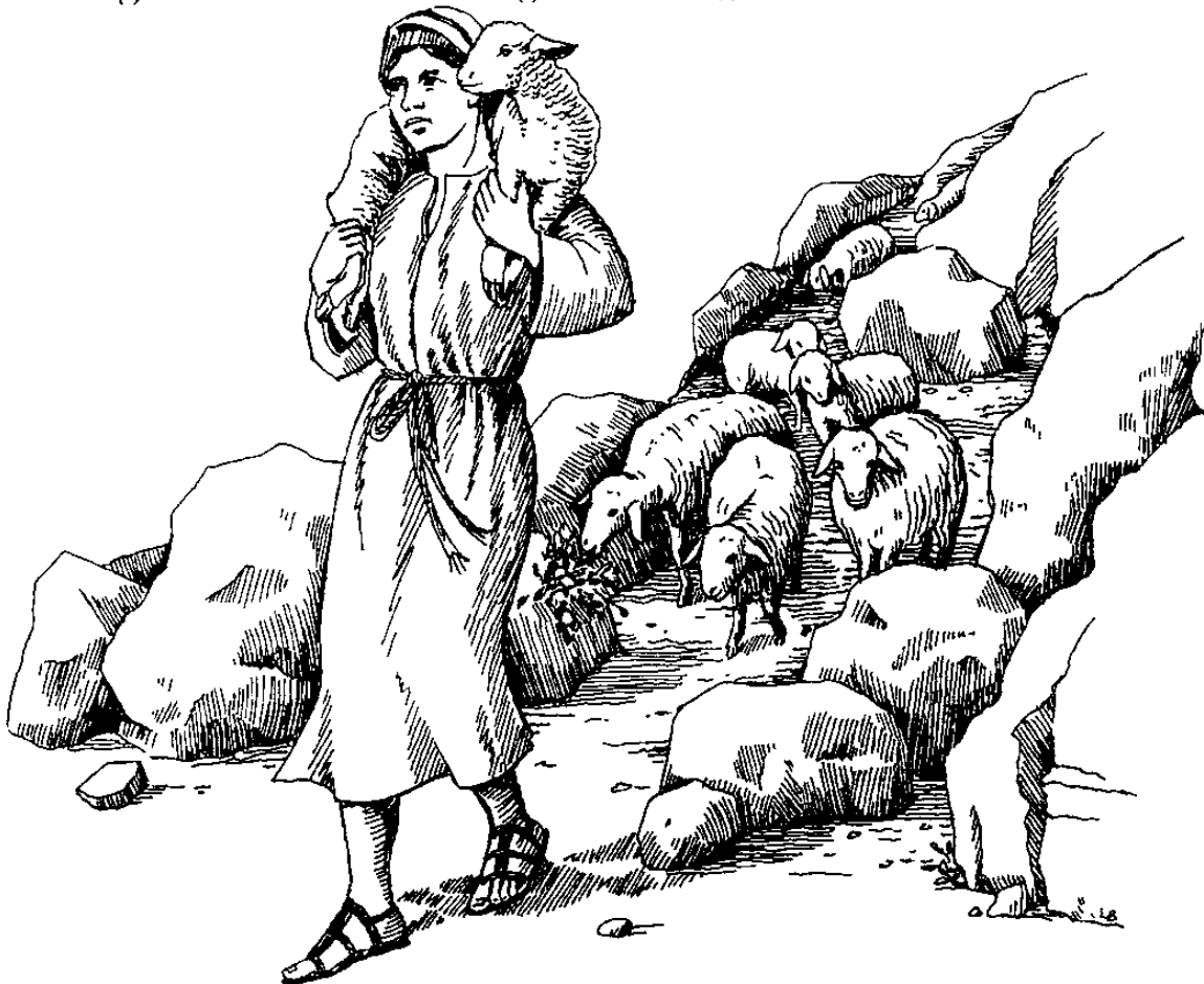
Magagalung ra moonsoi (10.11)

11 Aku noyo magagalung ra moonsoi, am magagalung ra moonsoi mampataak ra painawo Nano ra domba No rano. 12 Kaa' ulun gajjin, ondo' sala' ka magagalung kaapoam tatangan ra domba rano, pai' ru koson raginio. Paat makito no taani matong iruanin no ak domba rano am magiru' io. Ginio ra saamon am pantutuliaron bo domba rano ru taani no. 13 Magiru' io nga ulun gajjin io ak am pai' ru karaan pi bo domba rano. 14 Aku noyo magagalung ra moonsoi. Koson ri Ama' makaulig Raki' am Aku makaulig ri Ama', mogondo' niak ra Aku pana makaulig ra domba Ku rano am ilo niak makaulig Raki'. 15 Am Aku mampa-