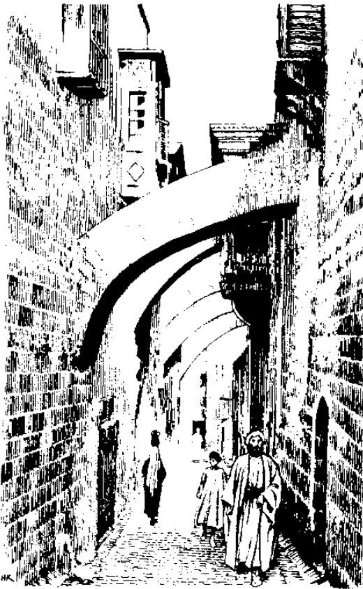
Ralan boborok ra bandar Jirusalim (5.1)

luminggan. Am paat aku mongoi sosop, makasigulu noyo ulun ra bokon.”