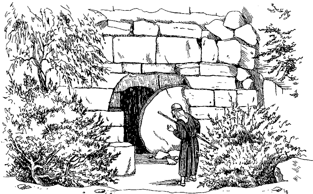
Ulun mampalilig ra lobong (20.5)

riso, “Kua pantangi' kou? Osoi uyumon mu?”