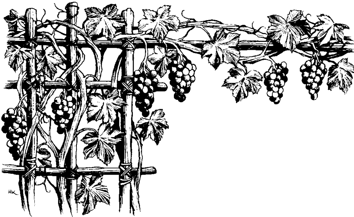
Kawa' ru anggur (15.1)

11 Ngaangai' ti pinabala' Ku ramuyun, maa' raginio masalok Aku mampakaansuk ramuyun am topot-topot kau maansukan. 12 Gitio noyo panusuban Kutu; kotogom kano ra rondo' am bo-